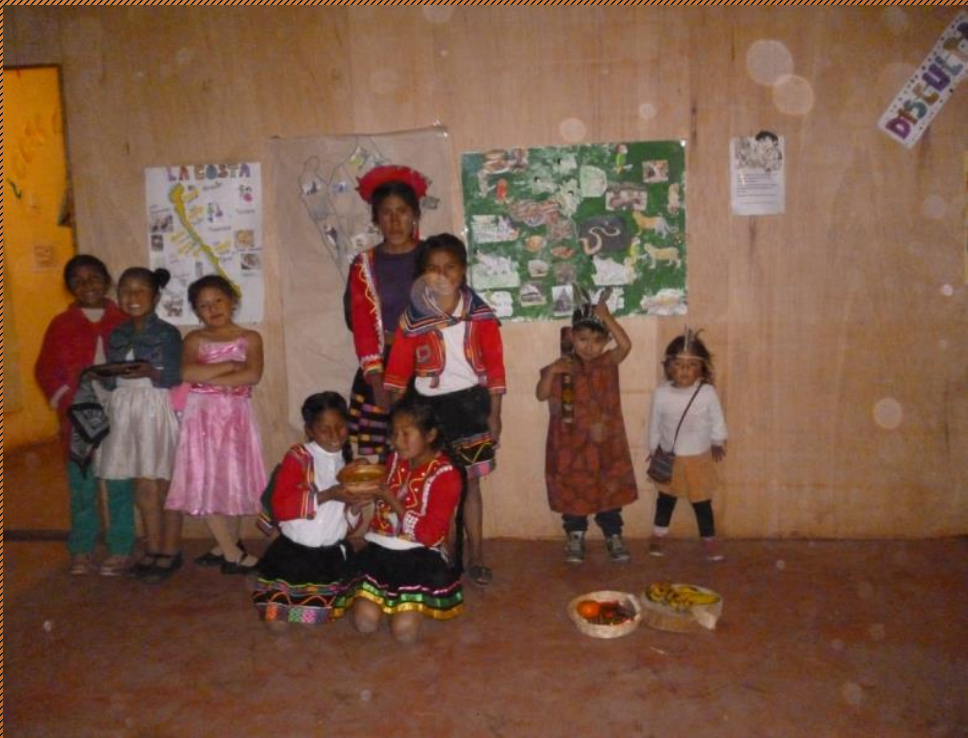
Lekker eten uit de 3 landstreken